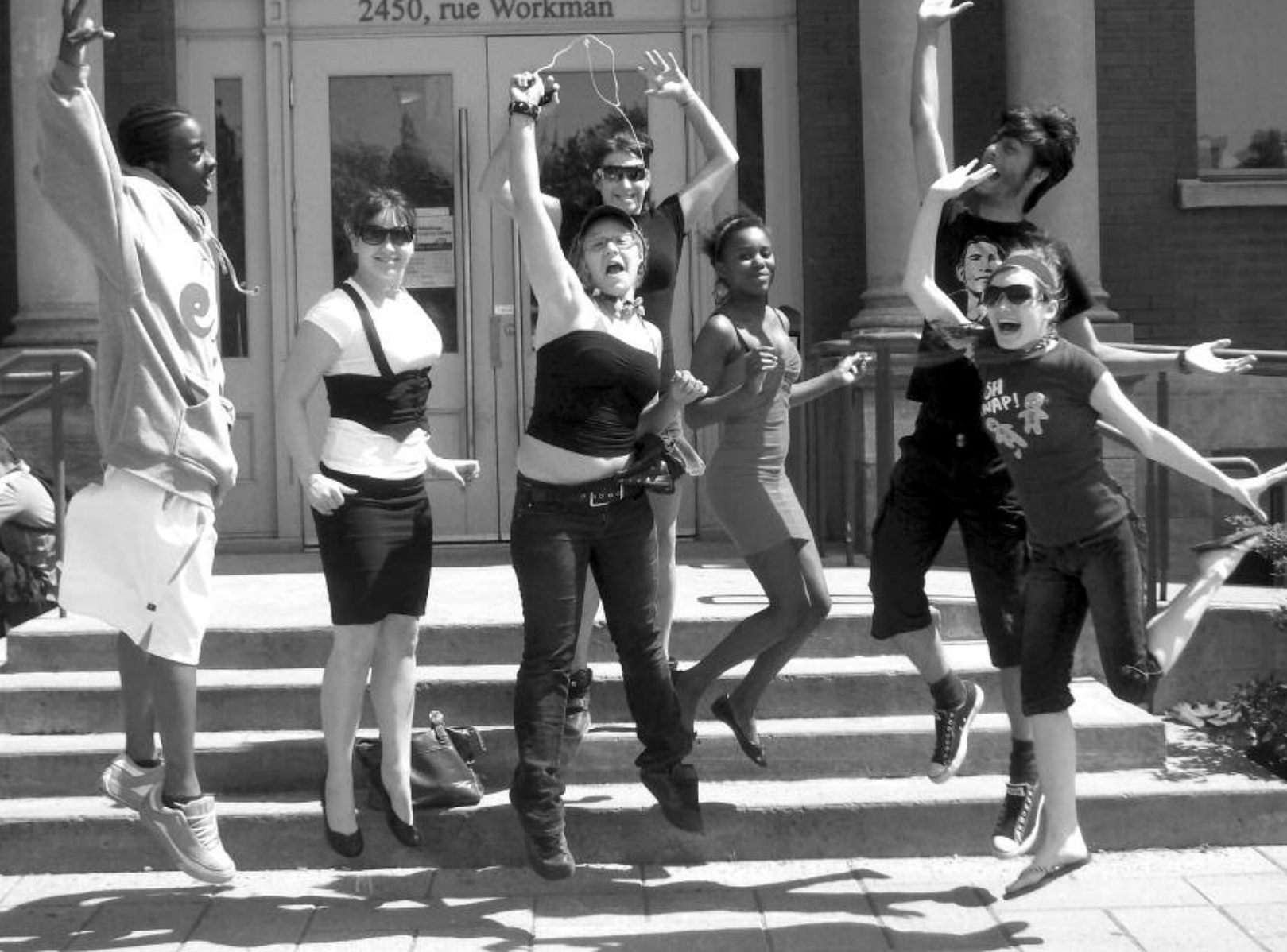
Ubuntu: la deuxième cohorte du projet Jeunes ambassadeurs du savoir