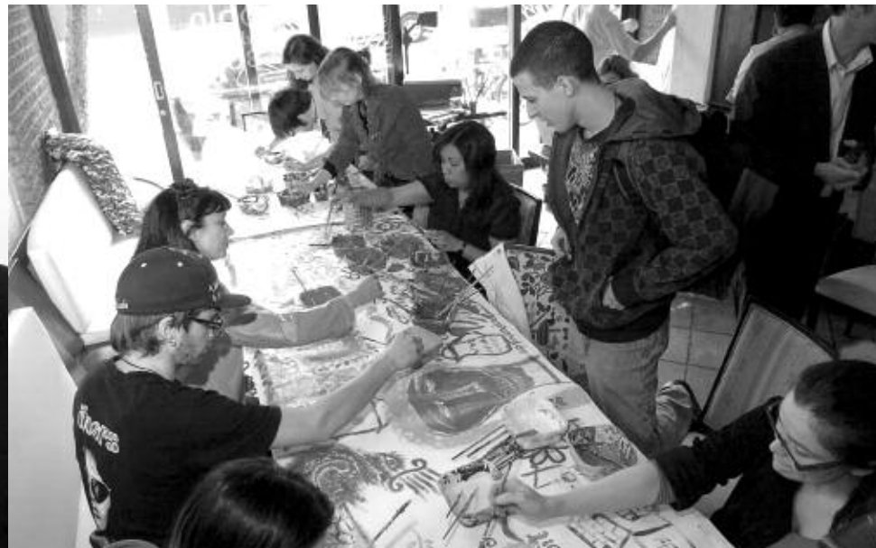
Animation d'un projet de création collective par le sculpteur engagé, Armand Vaillancourt, à l'occasion du lancement montréalais de la Grande Lecture.