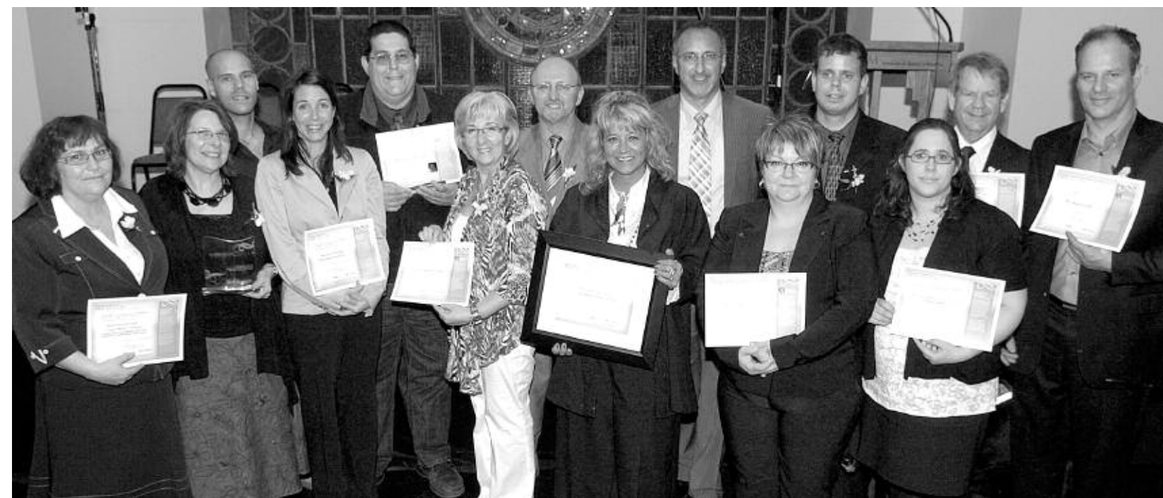
Récipiendaires et finalistes des Prix de l'ICÉA 2010