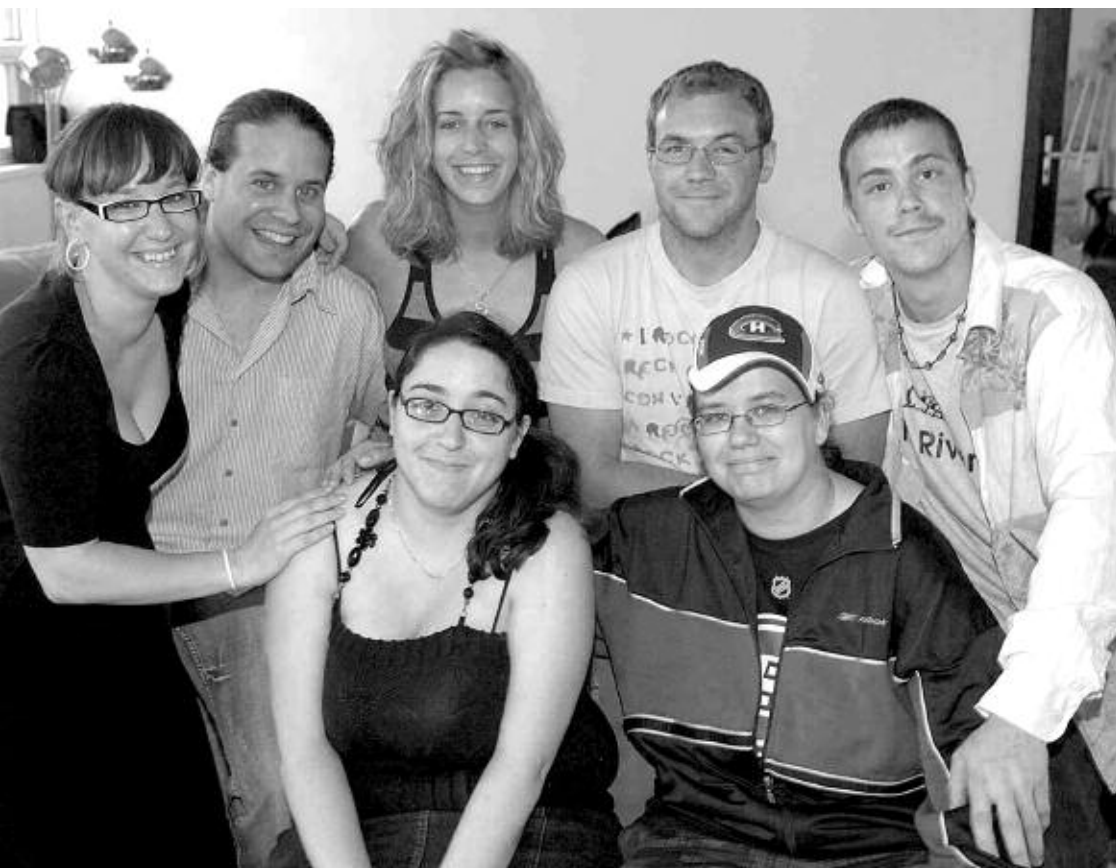
Les défricheurs : la première cohorte du projet Jeunes ambassadeurs du savoir

Finalement, divers projets touchant la promotion d'une culture de formation, la dynamisation de notre vie associative et nos communications complétaient notre programme de travail.